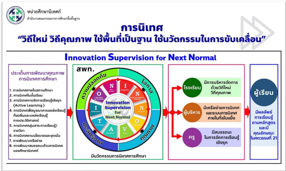
แผนภาพ การนิเทศวิถีใหม่ วิถีคุณภาพ ใช้พื้นที่เป็นฐาน ใช้นวัตกรรมในการขับเคลื่อน

เพิ่มประสิทธิภาพการบริหารจัดการ มุ่งเน้นการกระจายอำนาจ การมีส่วนร่วม การใช้เทคโนโลยี การประกันคุณภาพ ปรับกระบวนการนิเทศ ติดตามและประเมินผลการศึกษาขั้นพื้นฐาน ให้สอดคล้องกับชีวิตวิถีใหม่ (New Normal) และชีวิตวิถีปกติต่อไป (Next Normal) ดังที่แสดงในแผนภาพต่อไปนี้