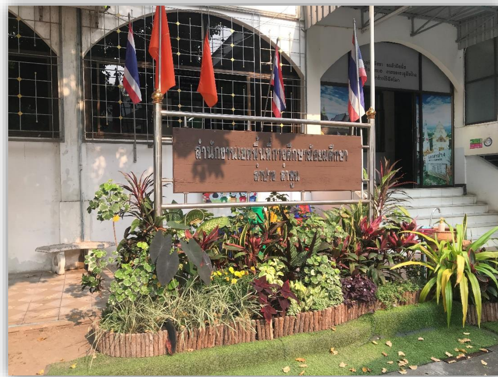
กลุ่มงานอำนวยการ ฝ่ายอาคารสถานที่

สำนักงานเขตพื้นที่การศึกษามัธยมศึกษา ลำปาง ลำพูน สำนักงานคณะกรรมการการศึกษาขั้นพื้นฐาน กระทรวงศึกษาธิการ